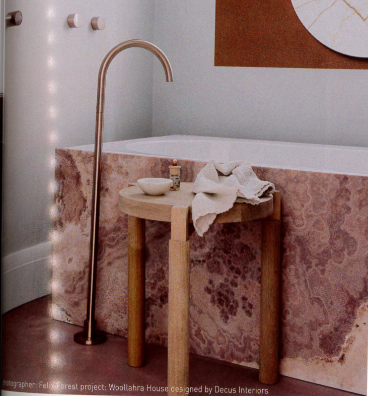
project: Woolahra House designed by Decus Interiors

相比墙出式的浴缸龙头，独立的款式的确占用不少空间，不过颜值很高。如果搭配整块天然香槟石材饰面，那么牺牲一点空间绝对是值得的。